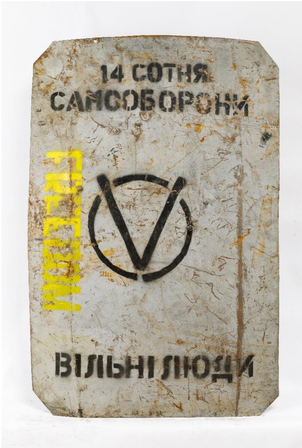
Щит члена 14-ї сотні Самооборони Майдану. Із фондів НМРГ

рукаві, яким командував майор Дмитро Садовник. Спецпризначенці намагалися звільнити від протестувальників майданчик поблизу будівлі палацу, відкривши вогонь на ураження.