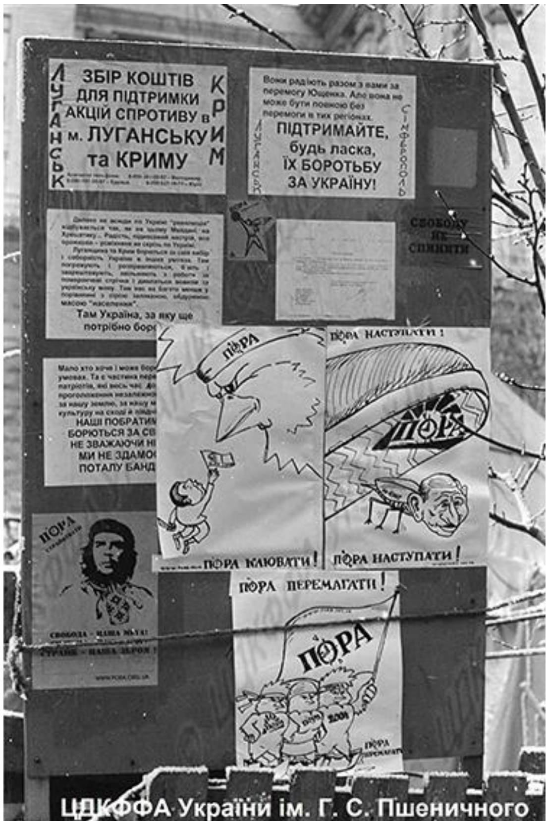
Агітаційні листівки на майдані Незалежності під час Помаранчевої революції. Київ, листопад 2004 року.