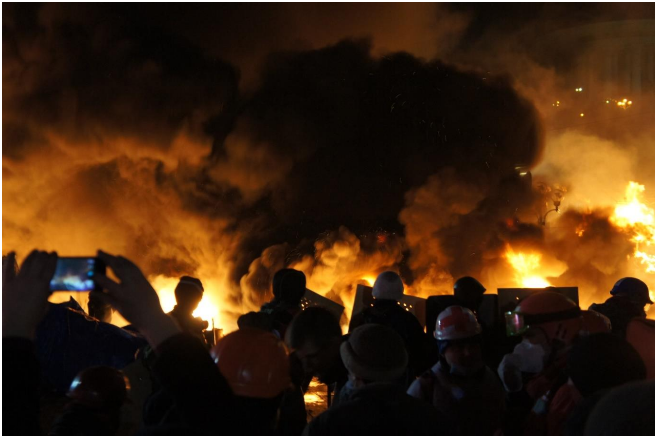
Оборона Майдану. Ніч проти 19 лютого 2014 року.

Того самого дня голова СБУ Олександр Якименко оголосив про початок проведення «антитерористичної операції», звинувативши учасників акцій протесту у вандалізмі, мародерстві, вбивствах, захопленні держустанов та зброї. Однак цю заяву було засуджено не лише лідерами демократичного світу та опозиційними політиками, а й деякими поплічниками Януковича. Ближче до вечора СБУ спростувала інформацію про початок антитерористичної операції. Почалися переговори лідерів опозиції з В. Януковичем, після яких було оголошено перемир'я.