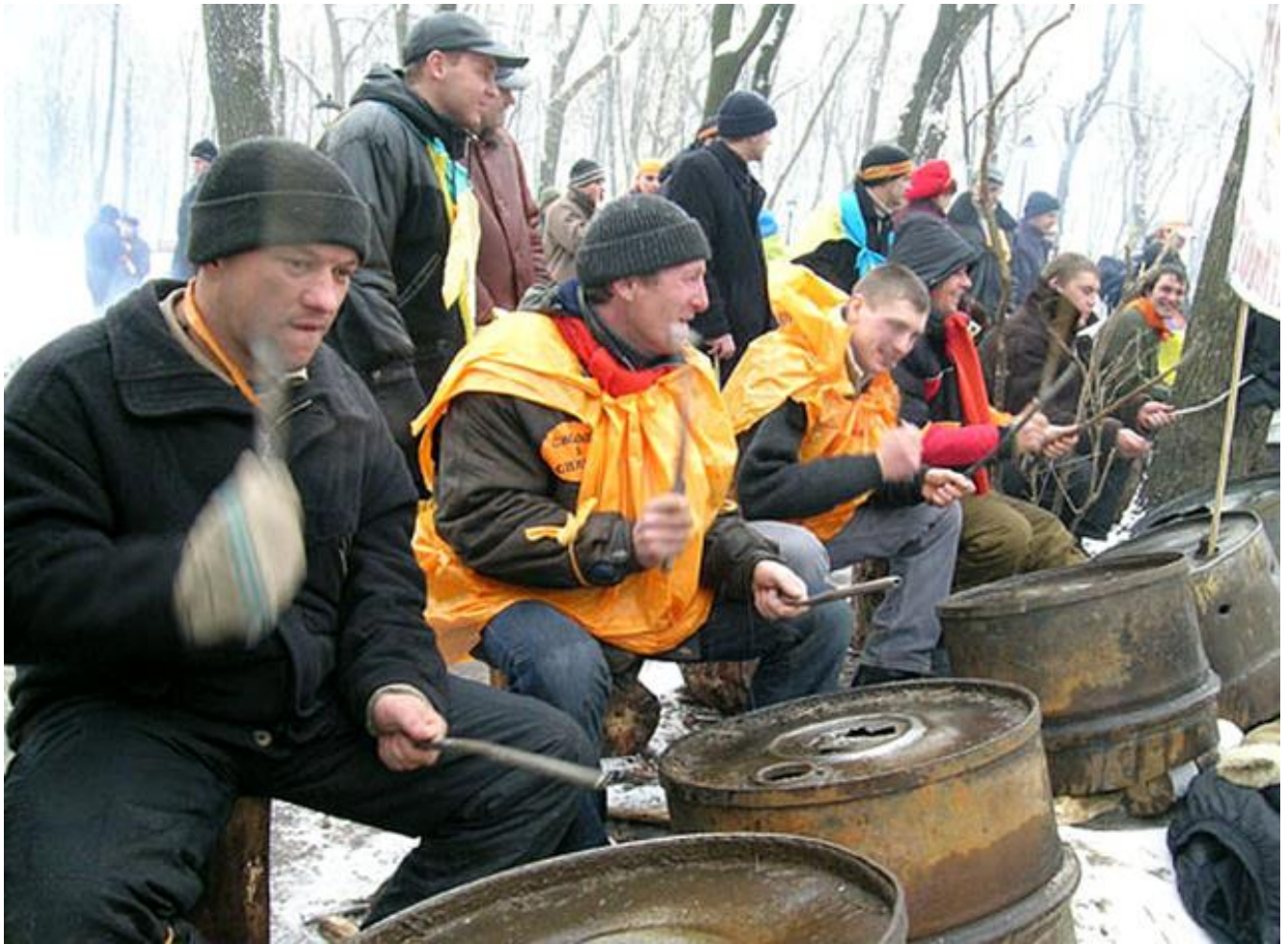
Барабанщики Помаранчевої революції.

Оригінальним виявом творчого духу Майдану стали «барабанщики революції» – група людей, які навпроти будівлі Кабінету Міністрів України стукали в металеві бочки, що залишилися в Маріїнському парку після мітингів прихильників Януковича.