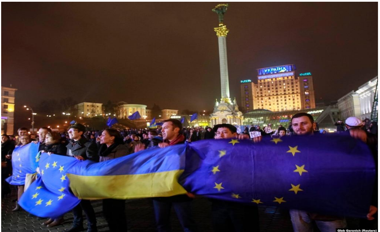
Мітинг на майдані Незалежності 21 листопада 2013 року на підтримку підписання Угоди про асоціацію з ЄС.

У ніч на 22 та вдень 22 листопада протестні акції розпочалися у Харкові, Хмельницькому, Житомирі, Миколаєві, Одесі, Рівному, Кіровограді, Сумах, Луганську, Чернівцях, Черкасах, Чернігові.