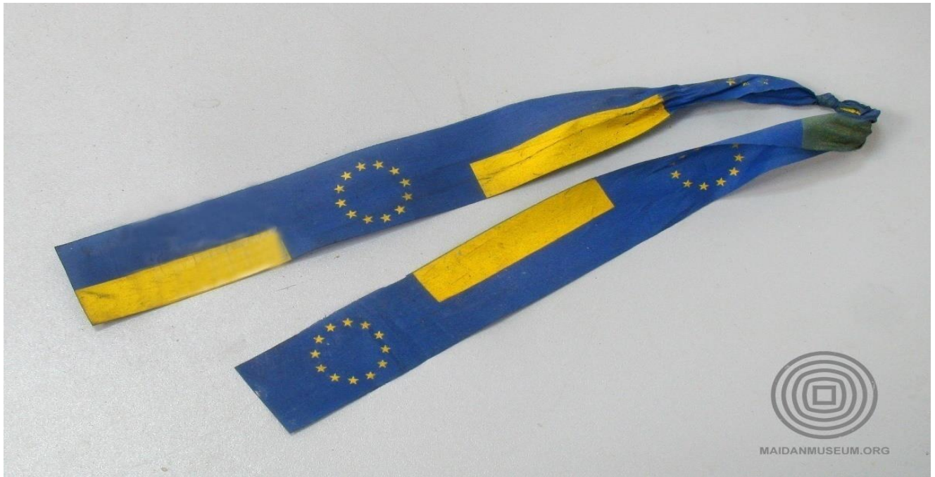
Стрічка із символікою Євросоюзу та кольорами прапора України.

Під час сутичок із силовиками – спочатку на вулиці Михайла Грушевського, а потім і на самому майдані Незалежності – символами активних протестів стали пляшки з «коктейлем Молотова», бруківка та шини , підпалюючи які протестувальники створювали вогняний кордон і димову завісу, що закривала їх від бійців МВС.