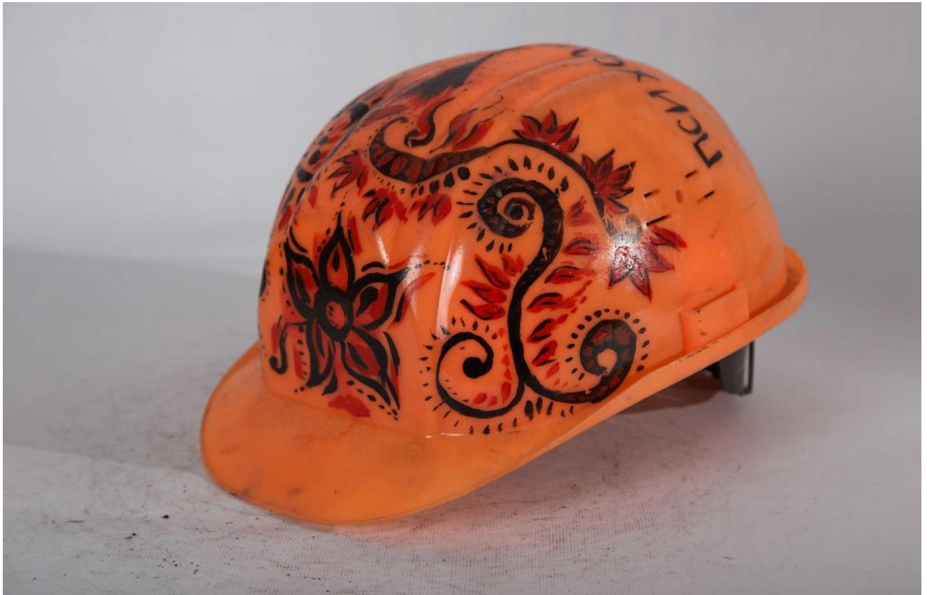
Каска волонтера психологічної служби Майдану. Із фондів НМРГ

Символом Майдану стала конструкція новорічної ялинки, встановлена на головній площі столиці. Майданівці називали її «йолкою». Ставши формальною причиною побиття людей у ніч на 30 листопада 2013 року, згодом вона перетворилася на один із головних символів протесту. Мітингарі прикрасили її прапорами, плакатами, банерами тощо.