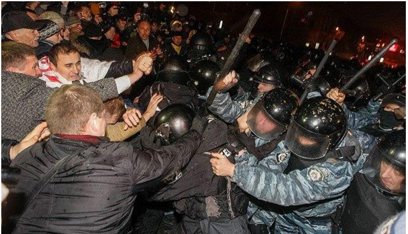
Побиття мітингувальників біля монумента Незалежності у ніч на 30 листопада 2013 року.

Офіційною причиною розгону Євромайдану назвали підготовчі роботи з установаження традиційної новорічної ялинки в центрі Києва.