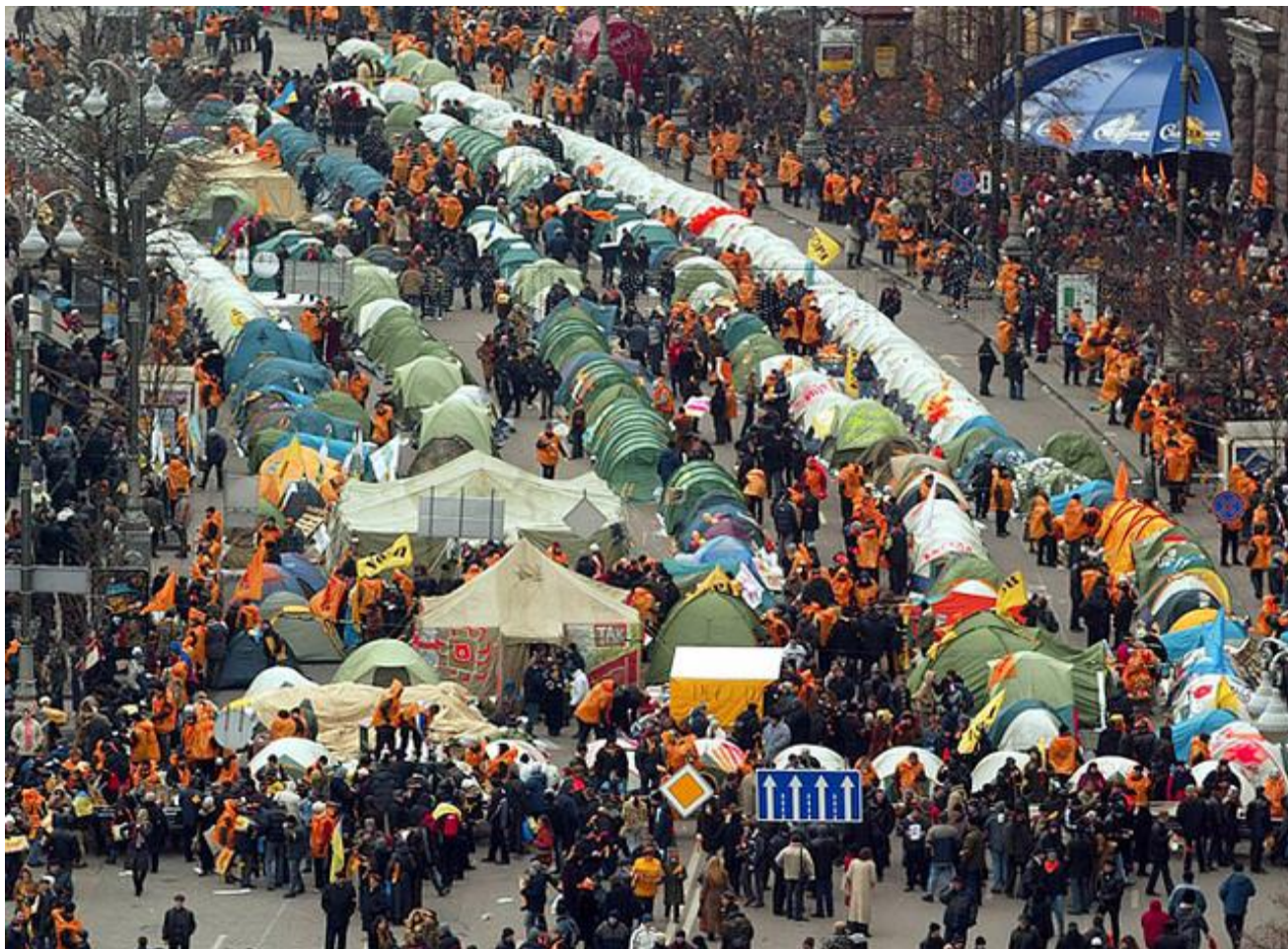
Наметове містечко у середмісті Києва.

Позачергова сесія Київської міської ради висловила недовіру Центральній виборчій комісії (ЦВК) та звернулася до Верховної Ради з проханням не визнавати попередні результати підрахунку голосів. Одночасно Київська міська державна адміністрація зобов'язала Київську міську державну адміністрацію забезпечити належні умови для проведення масових акцій у Києві та охорону громадського порядку.