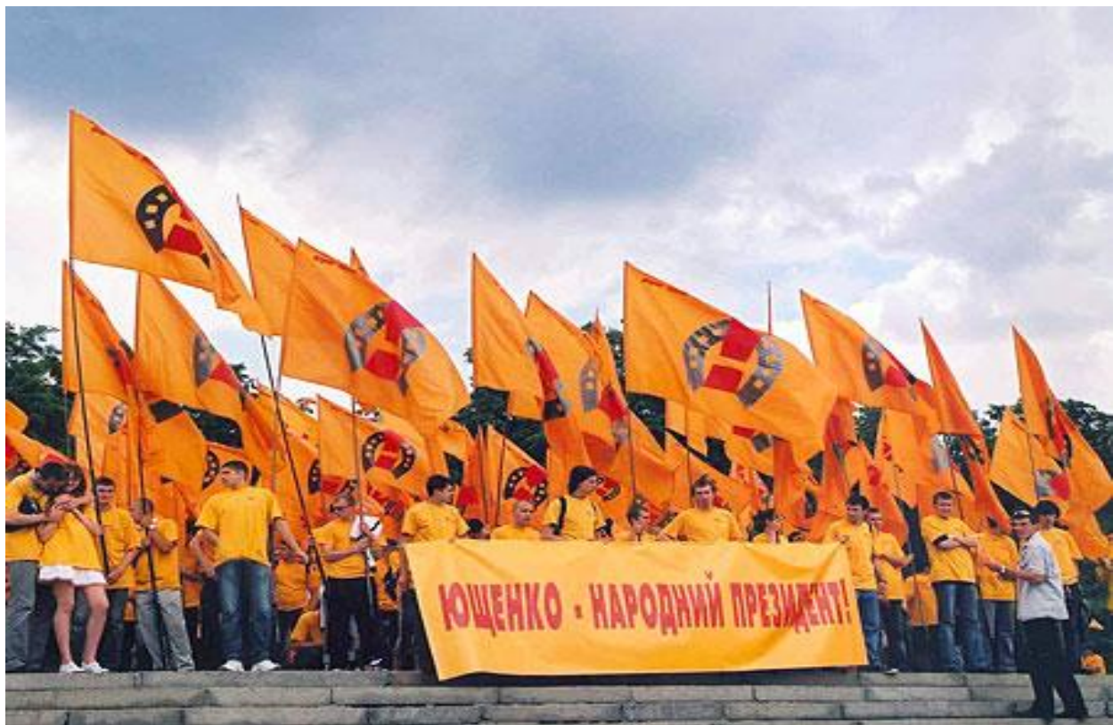
Учасники передвиборчої кампанії на підтримку кандидата в президенти Віктора Ющенко.

Ці події було названо Помаранчевою революцією через помаранчевий колір символіки виборчої кампанії кандидата в президенти Віктора Ющенко.