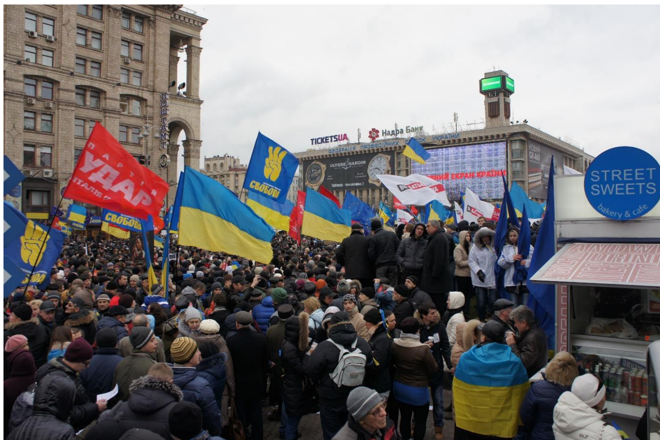
Мітинг на майдані Незалежності 1 грудня 2013 року.

На вулиці Банковій неподалік від Адміністрації президента відбулися сутички між мітингарями та «Беркутом», під час яких потерпіли зокрема українські та іноземні журналісти.