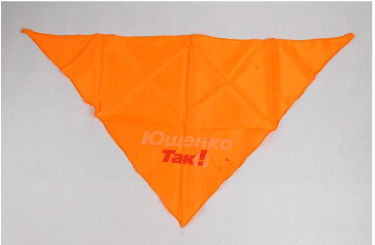
Хустина учасника Помаранчевої революції.

Окрім стрічок, з інших атрибутів помаранчевого Майдану використовували помаранчеві прапори з логотипом партії «Наша Україна» у вигляді підкови зі знаком оклику й написом «Так», наліпки, плакати, а також елементи одягу помаранчевого кольору: накидки (дощовики), хустки, шарфи тощо.